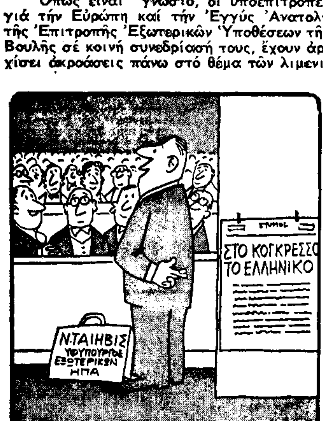
—'Ελπίζω ότι ο κοινοβουλευτικός θα επανέλθει σύντομα εις την 'Ελλάδα... (Τού Κώστα Μπρόπουλου)